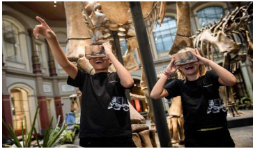
<실감 장비 착용 예시>