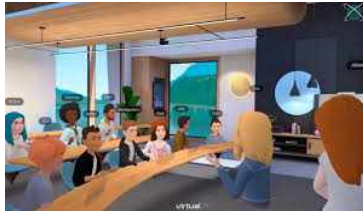
<교육관련 콘텐츠 예시>