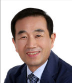
김 양 희 의원