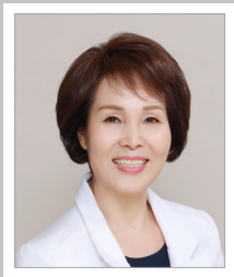
부의장 박경희 Park, Kyung Hee