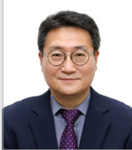
서 호 성 의원