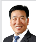
이 동 화 의원