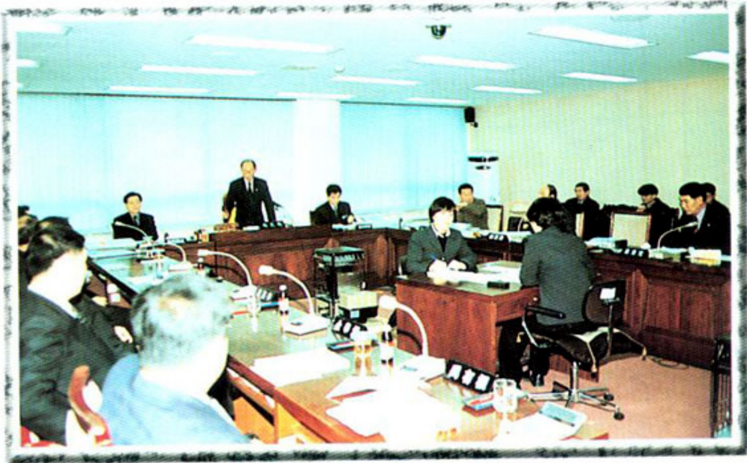
▶ 예산결산특별위원회 회의장면