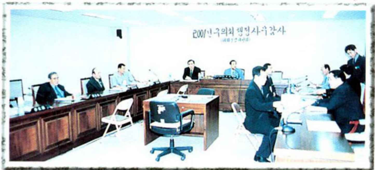
▶ 2001년도 제1차 정례회 구행정사무감사 (의회운영위원회)