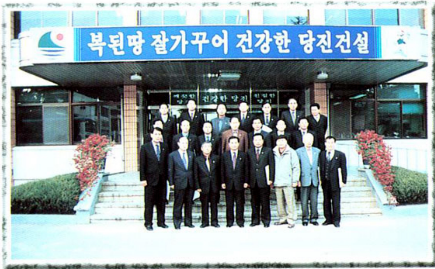
▶ 당진군의회 비교시찰 방문 (2000. 11. 23 ~ 11. 25)