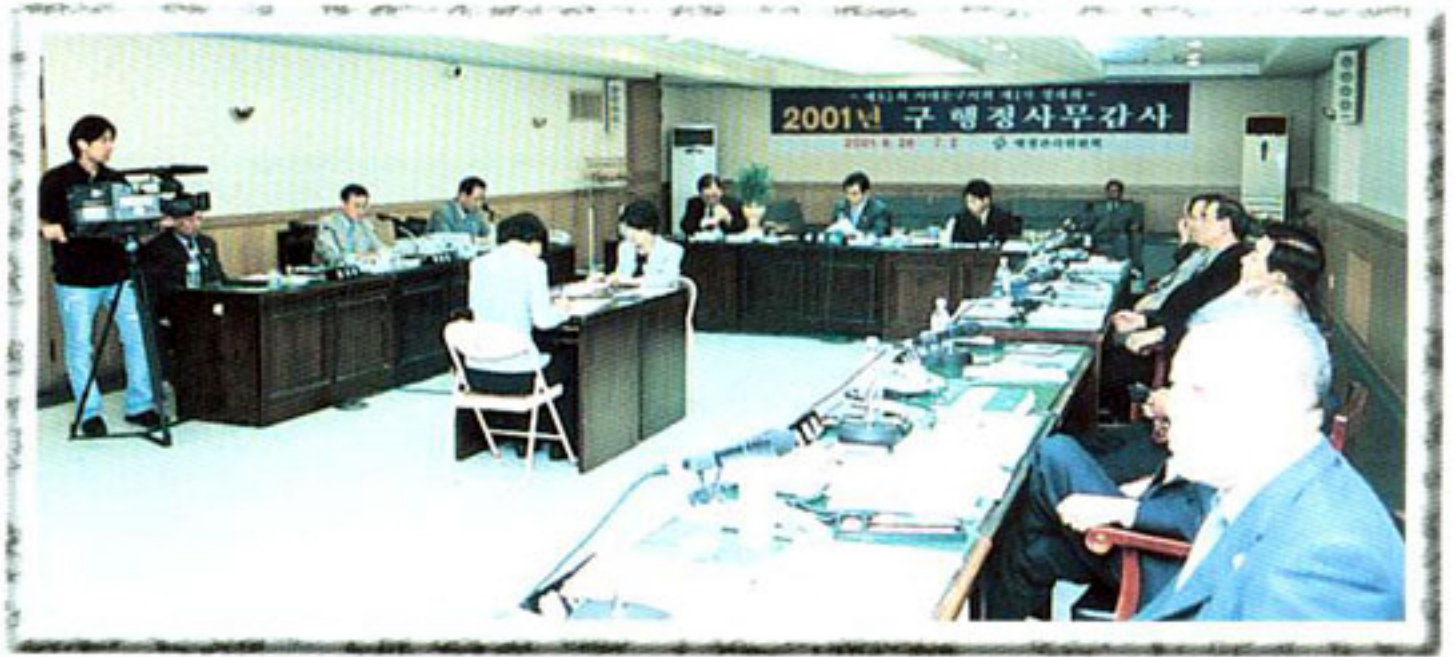
▶ 2001년도 제1차 정례회 구행정사무감사 (행정관리위원회)