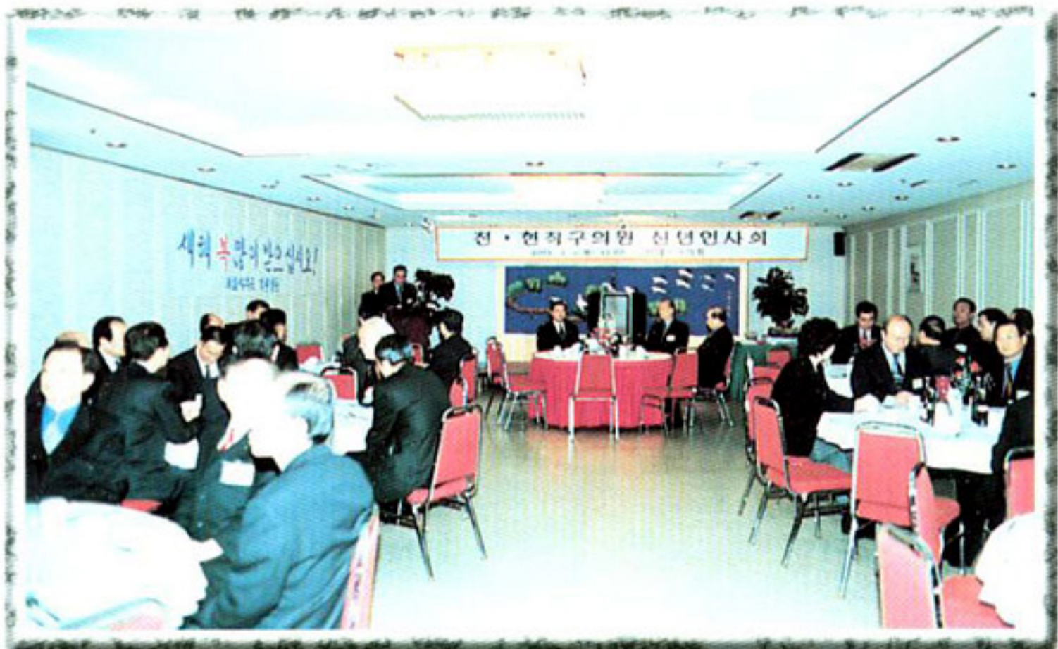
▶ 2001년 전·현직 구의원 신년인사회 행사