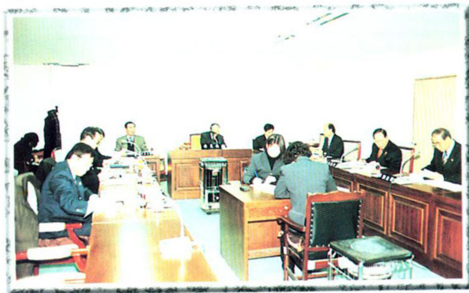
▶ 세외수입관리실태 특별위원회 회의장면