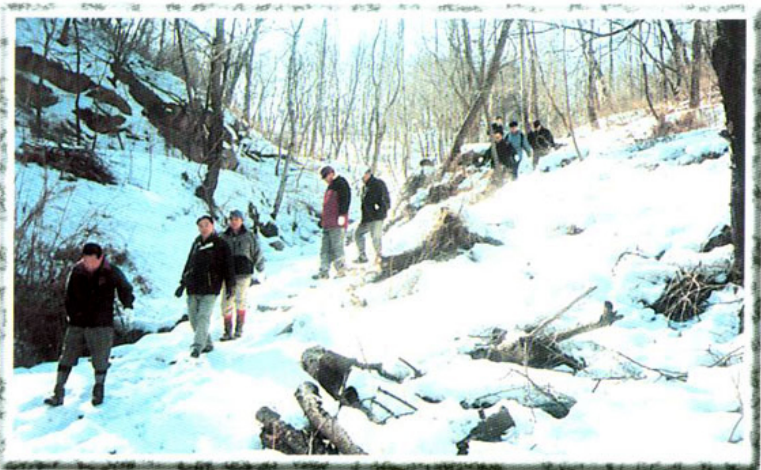
▶ 관내산 환경보존 대책특별위원회 (현장활동중 이동모습)