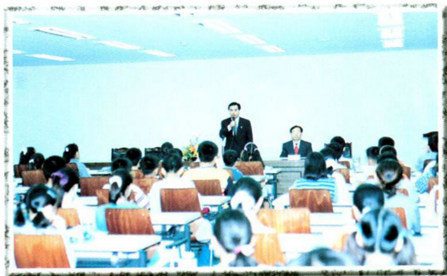
▶ 초등학교 어린이 의회방문 (관내 연가초등학교)