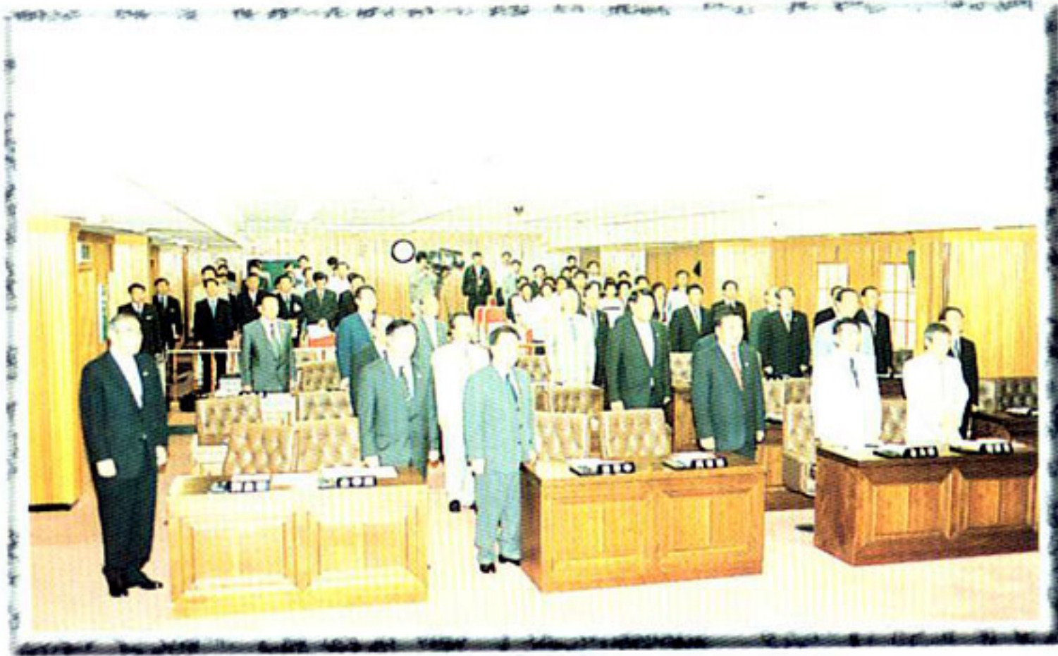
▶ 본회의장 (개회식)