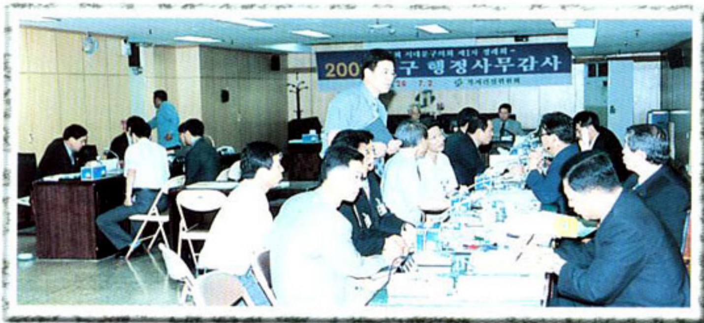
▶ 2001년도 제1차 정례회 구행정사무감사 (복지건설위원회)