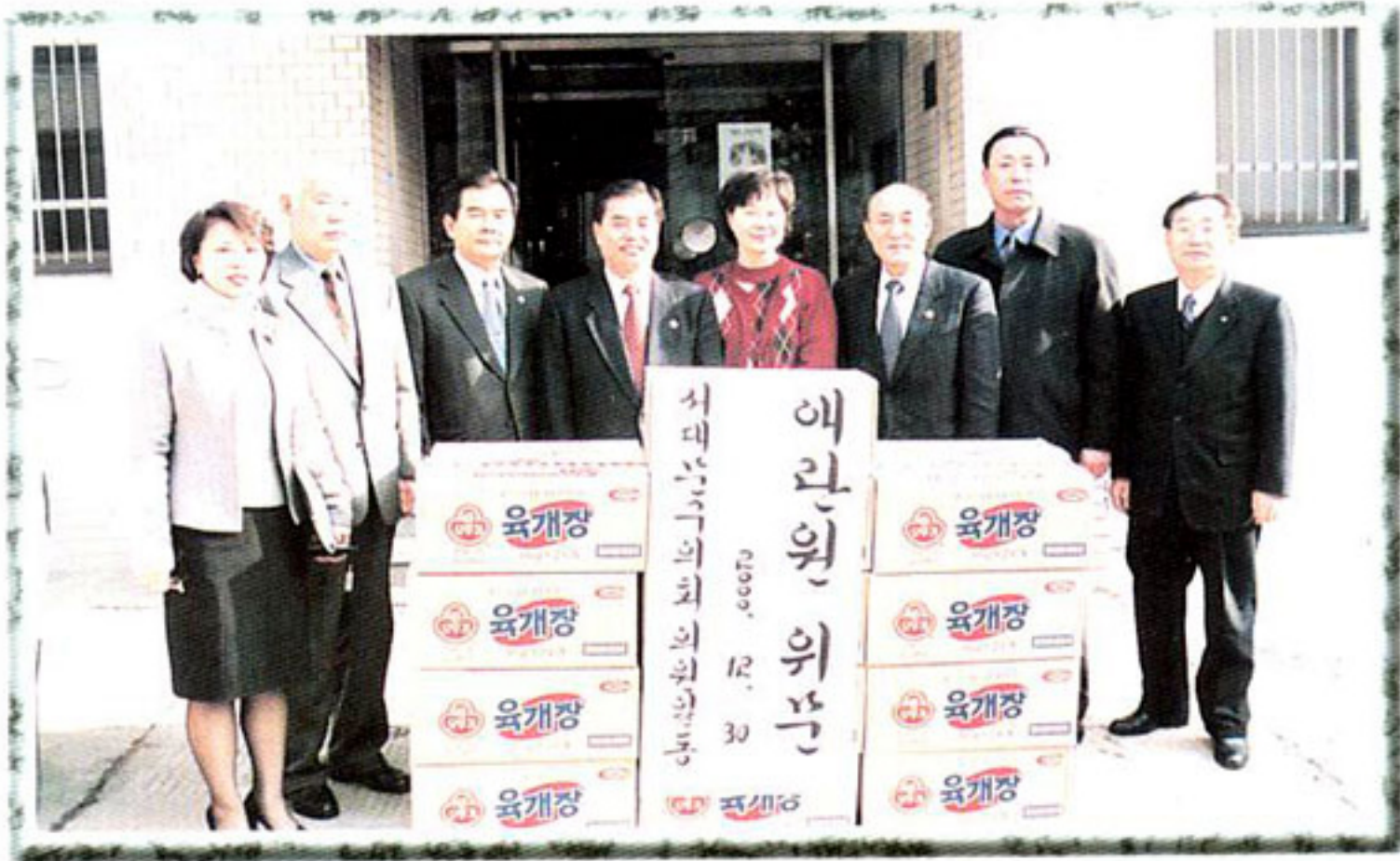
▶ 불우이웃돕기활동 (관내 에란원 위문)