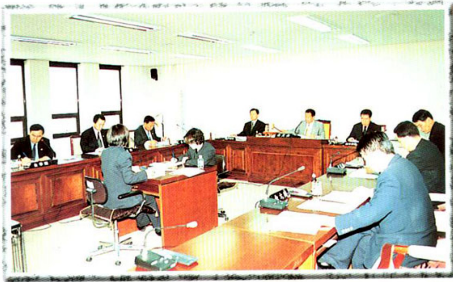
▶ 관내산 환경보존 대책특별위원회 (회의장면)