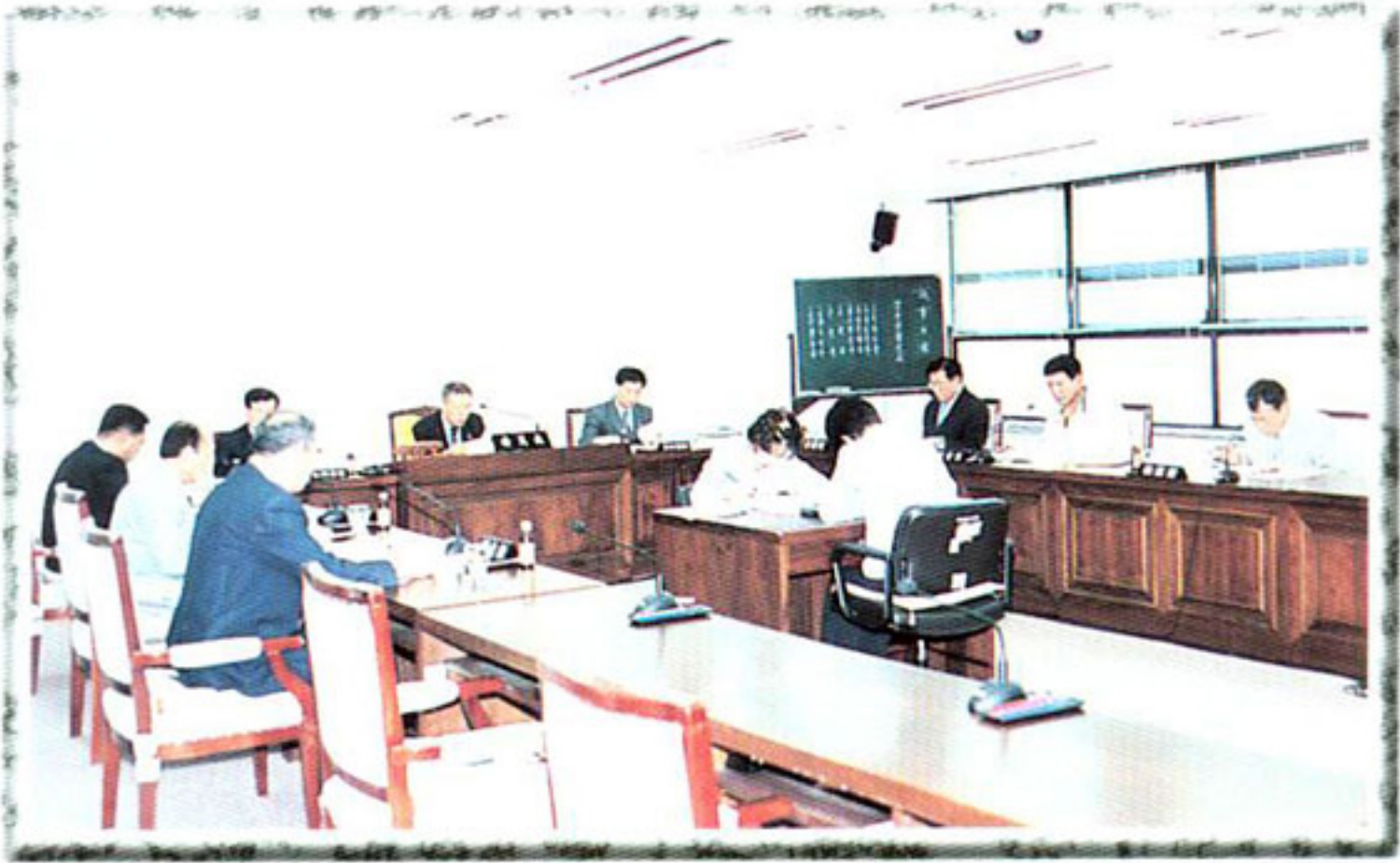
▶ 재해대책특별위원회 (회의장면)