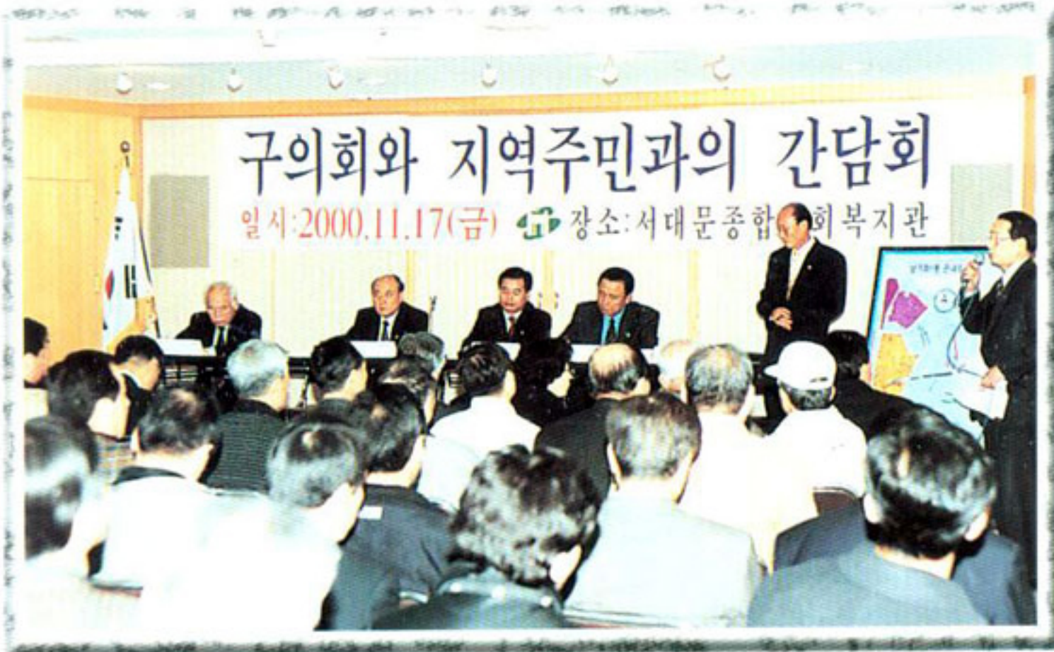
▶ 지역주민과의 간담회 (2000. 11. 6 ~ 12. 23)