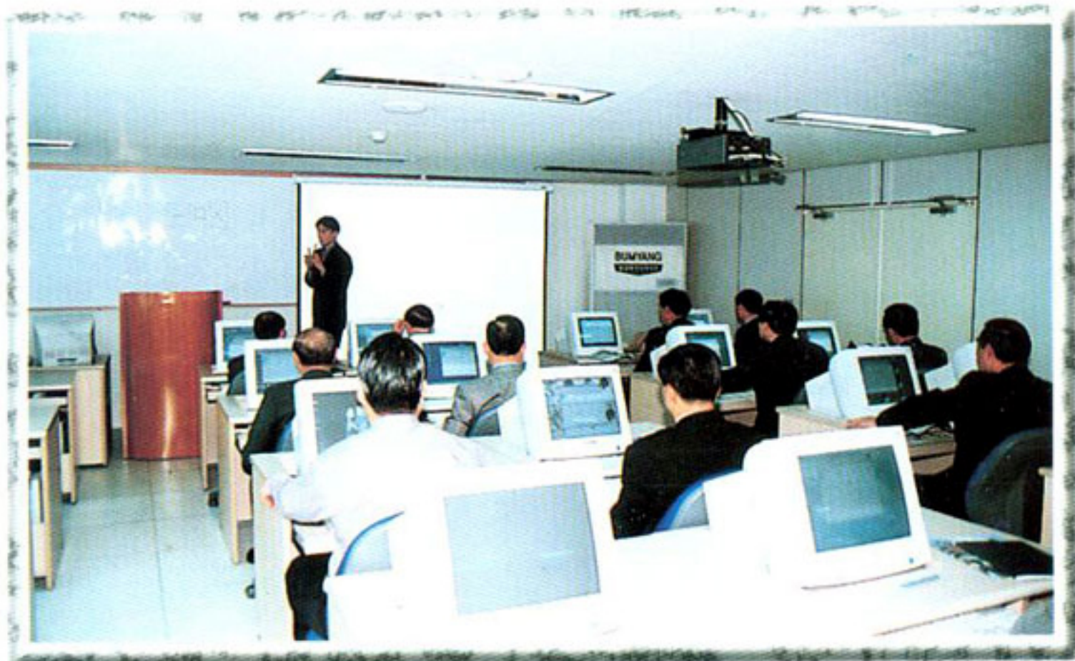
▶ 의원 정보화 특별교육