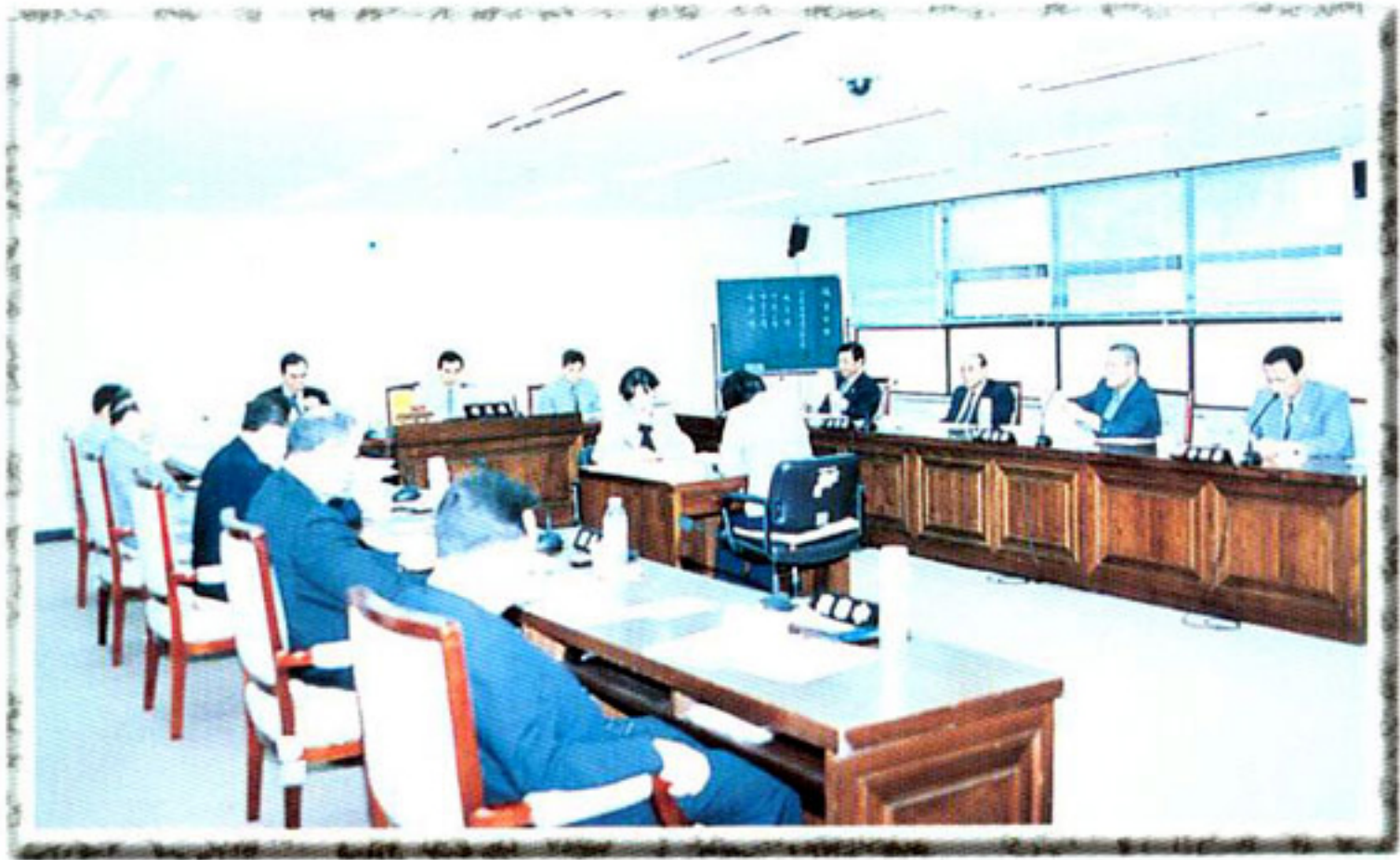
▶ 상임위원회 회의 (행정관리위원회)