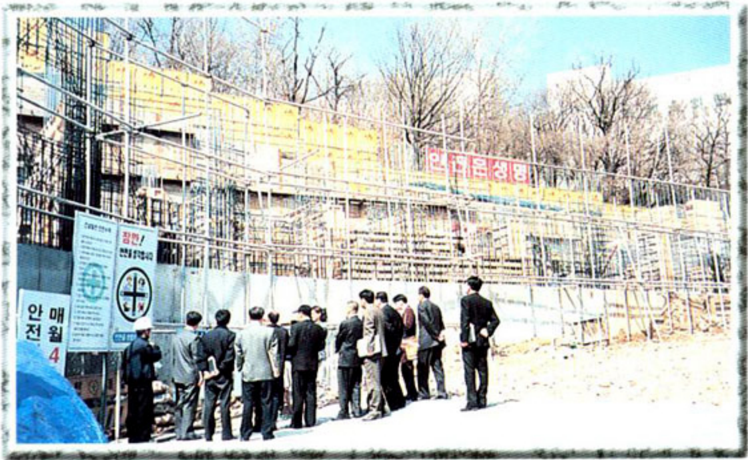
▶ 재해대책특별위원회 (공사장 현장확인)