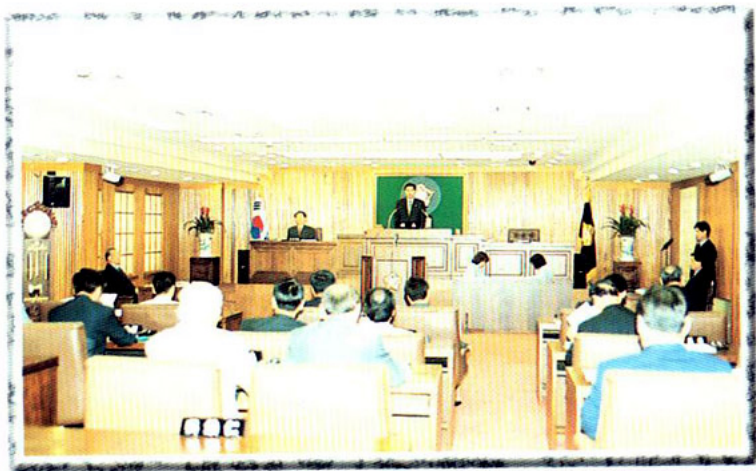
▶ 본회의 (회의장면)