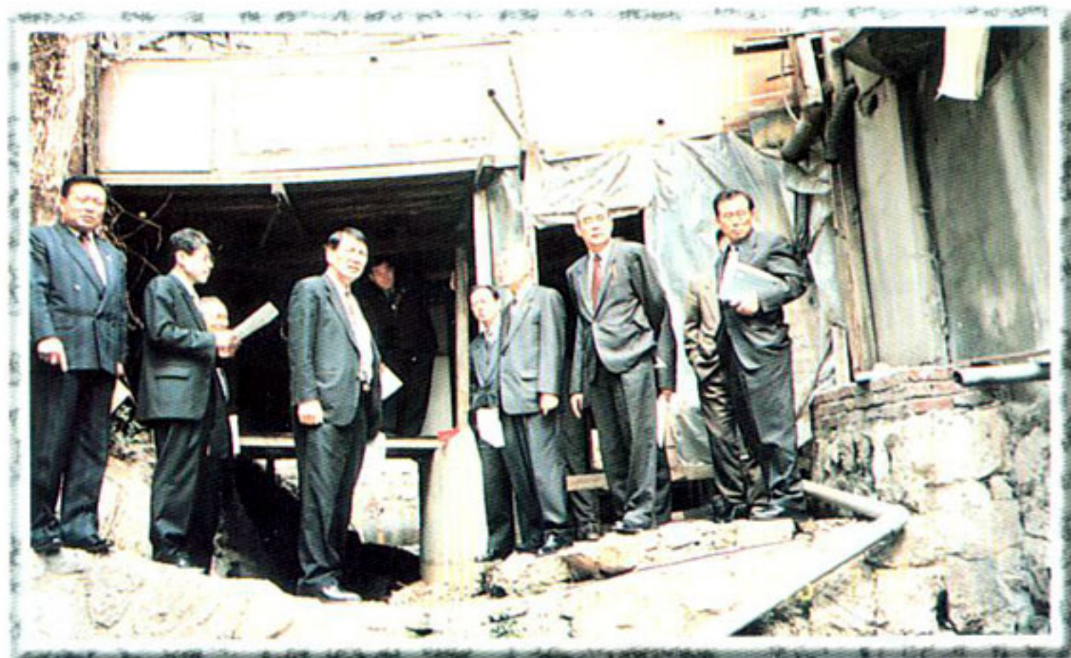
▶ 재해대책특별위원회 (봉원동 위험 건축물 현장확인)