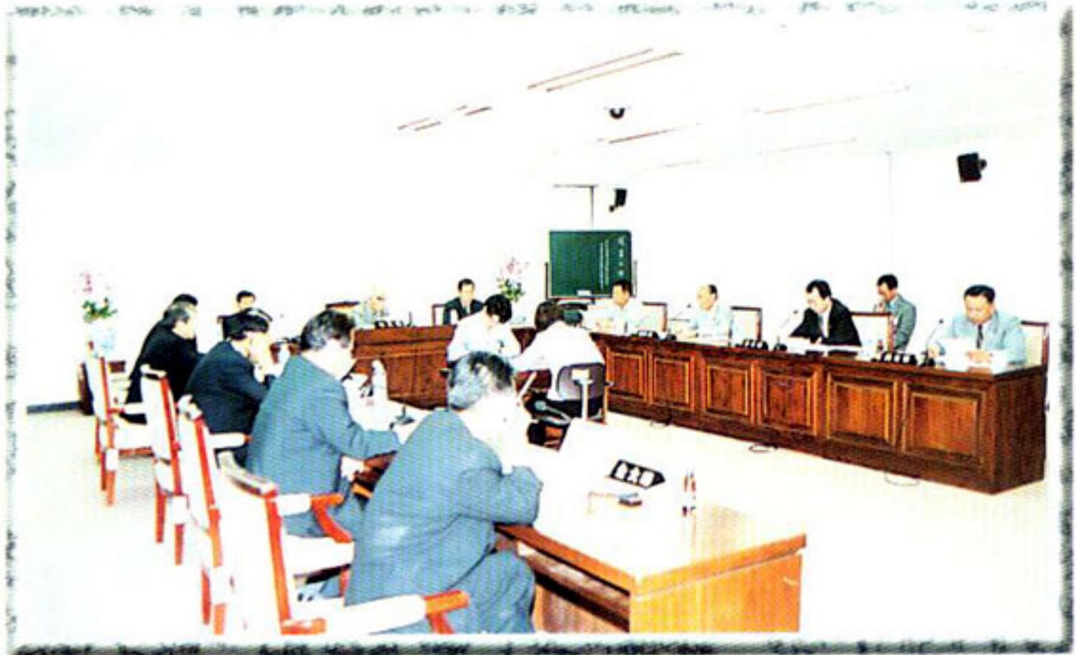
▶ 상임위원회 회의 (복지건설위원회)