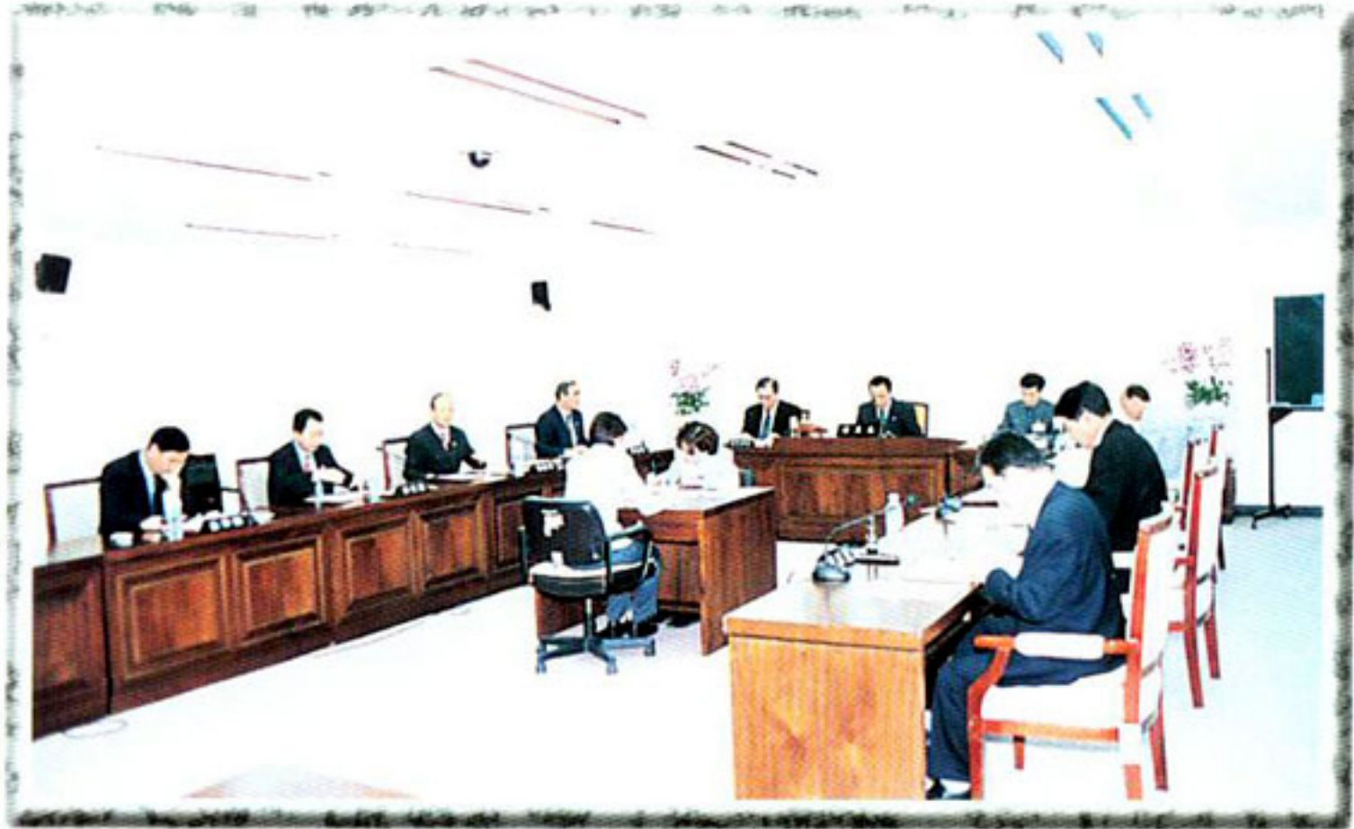
▶ 상임위원회 회의 (의회운영위원회)