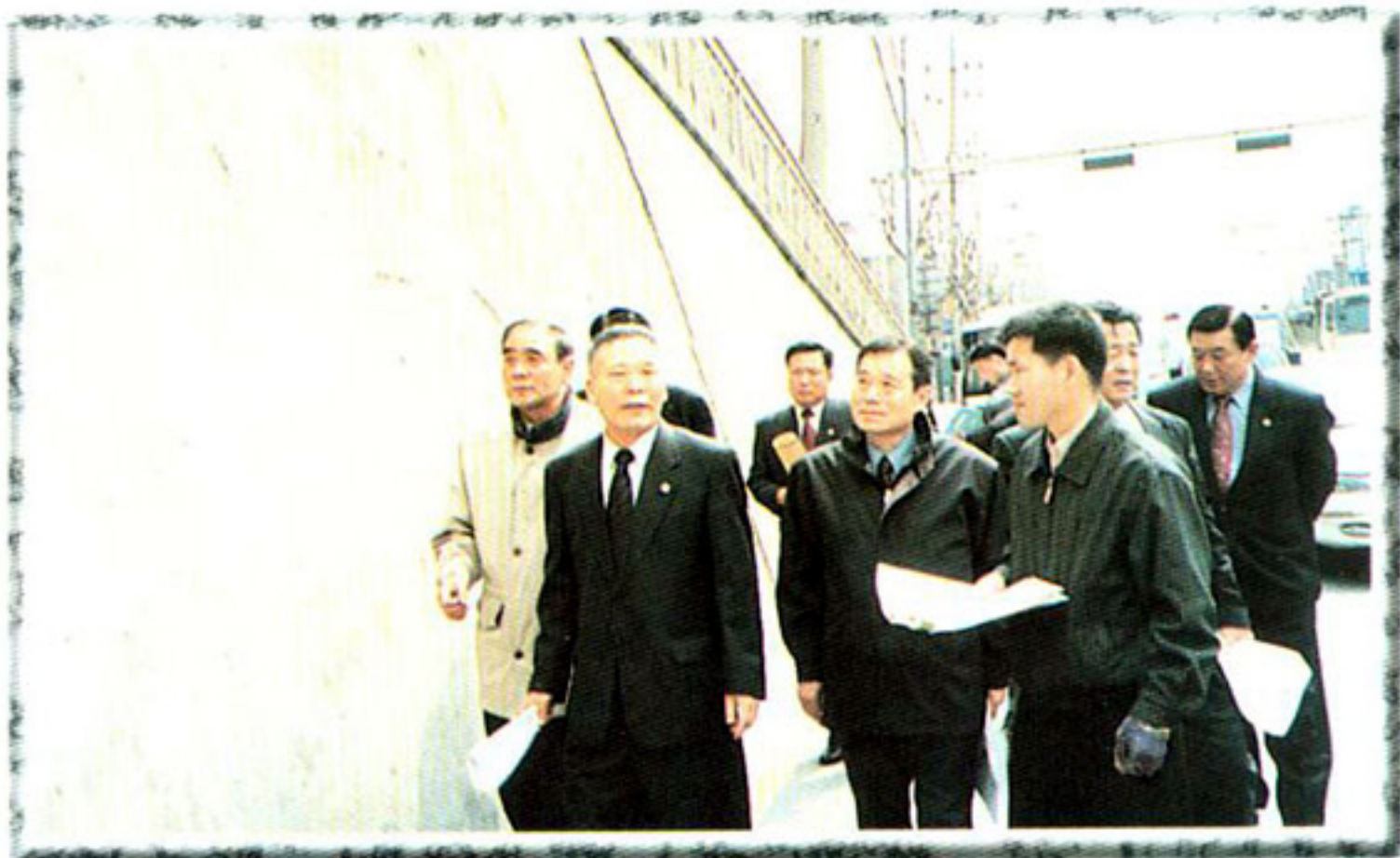
▶ 재해대책특별위원회 (관계공무원으로부터 불량옹벽현황청취)