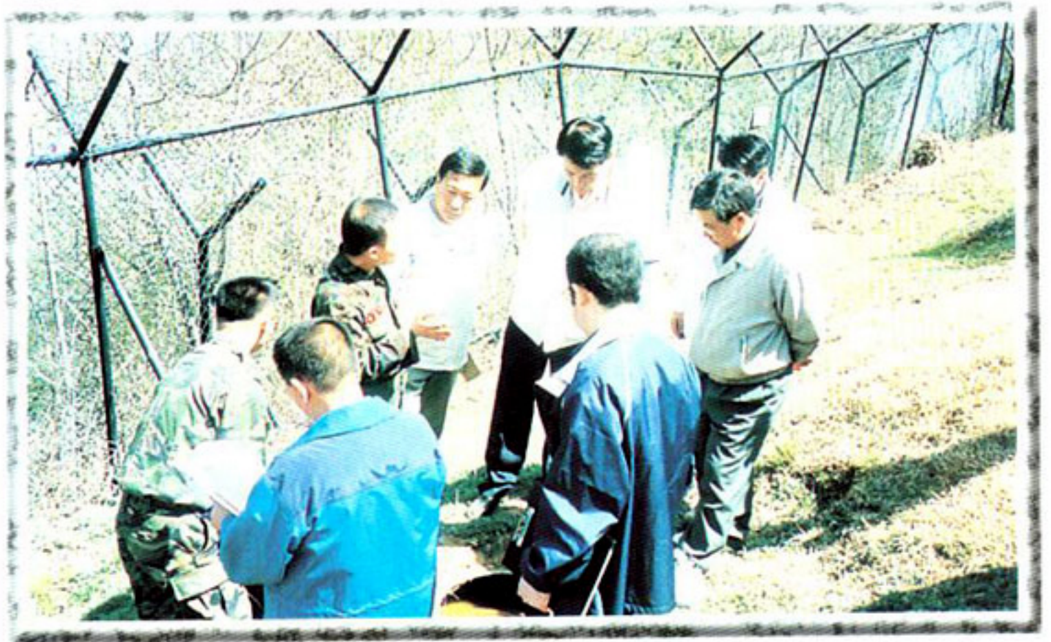
▶ 관내산 환경보존 대책특별위원회 (현장점검활동)