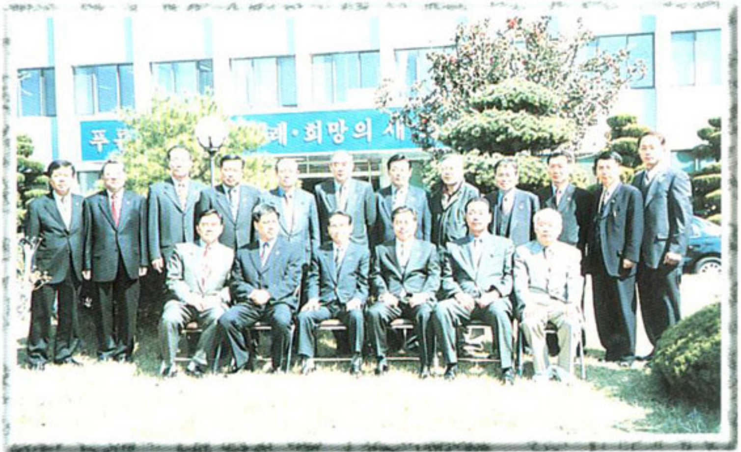
▶ 보성군의회 비교시찰 방문 (2001. 4. 11 ~ 4. 14)