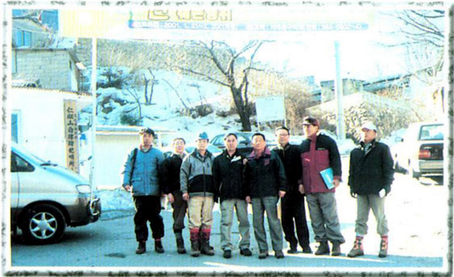
▶ 관내산 환경보존 대책특별위원회 활동중 (인왕산 진입로 입구)