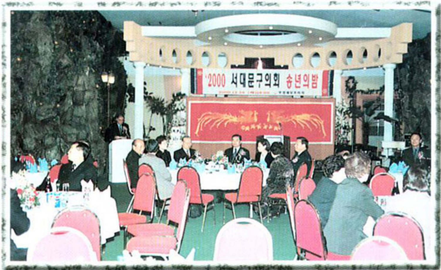
▶ 2000년 서대문구의회 송년의 밤 행사 (2000. 12. 28)