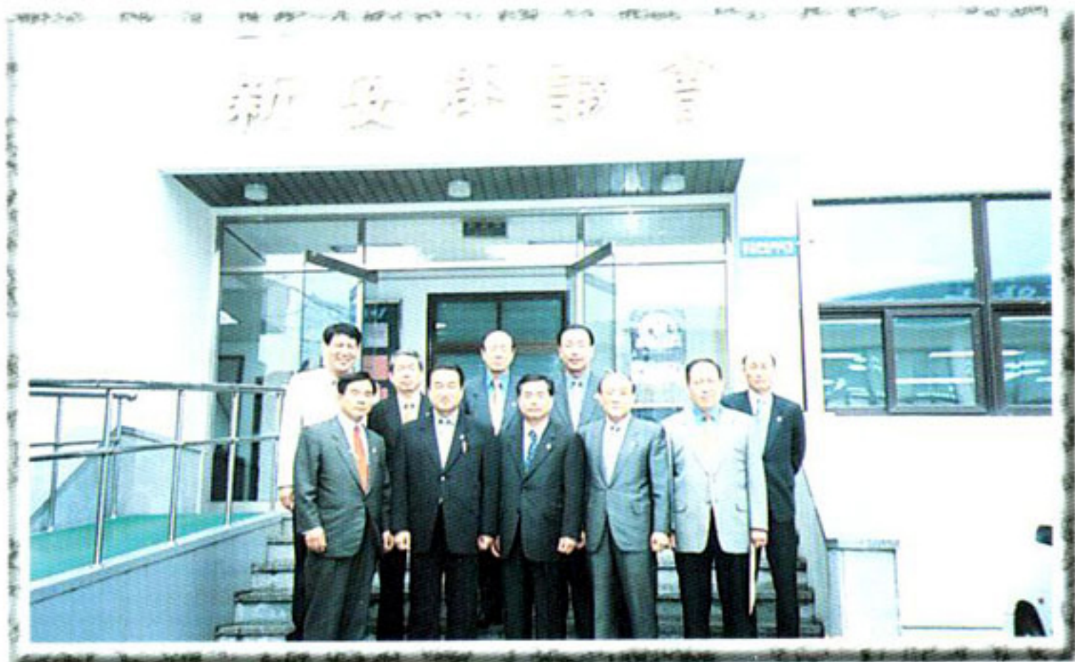
▶ 신안군의회 비교시찰 방문 (2001. 4. 11 ~ 4. 14)